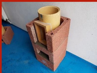
Fig. 9. Așezare manta