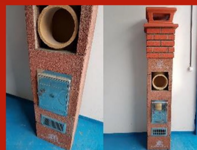
Fig. 20. Finalizare horn