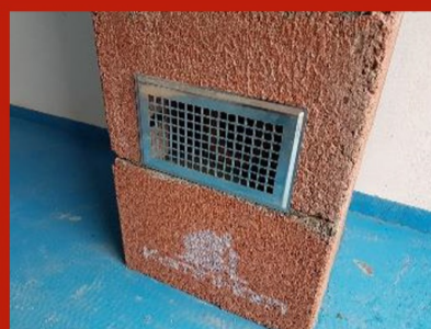
Fig. 19. Grilaj ventilație