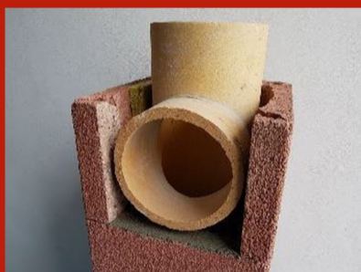
Fig. 13. Montare racord