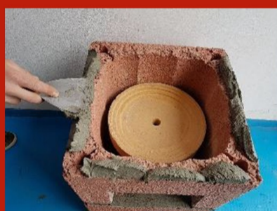
Fig. 5. Aplicare adeziv