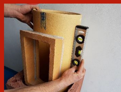
Fig. 8. Verificare cu nivela