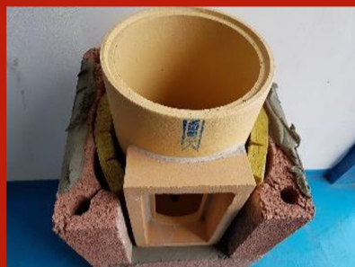
Fig. 10. Aplicare adeziv