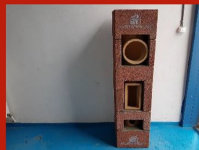
Fig. 16. Continuare horn