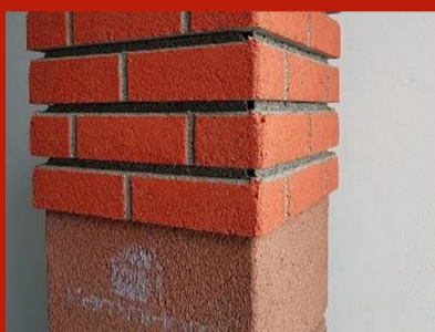
Fig. 17. Elementi decorativi