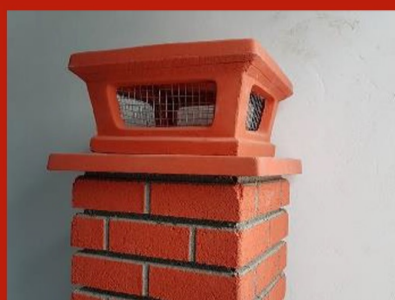
Fig. 18. Guler + pălărie