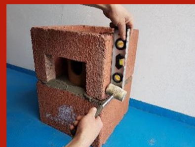
Fig. 4. Așezare manta