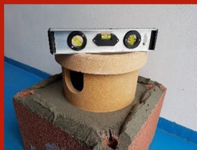
Fig. 3. Bază preluare condens