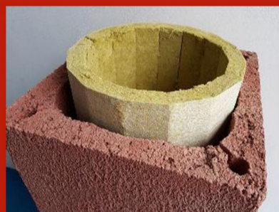
Fig. 15. Introducere vată