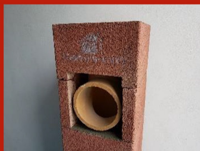
Fig. 14. Manta decupată