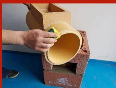
Fig. 6. Curățare bază