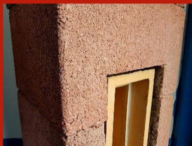
Fig. 11. Manta decupată