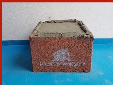
Fig. 1. Fundația hornului