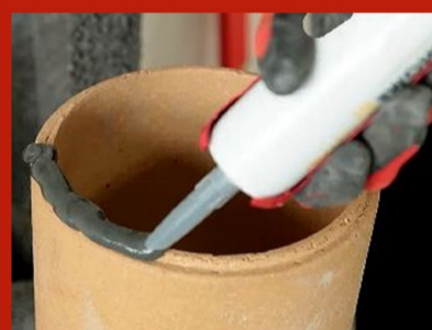
Fig. 7. Aplicare silicon