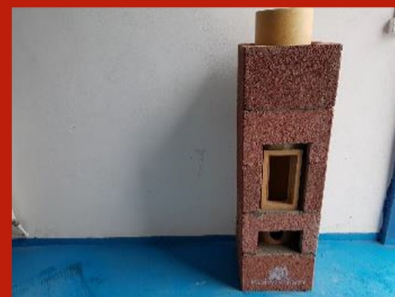
Fig. 12. Continuare horn